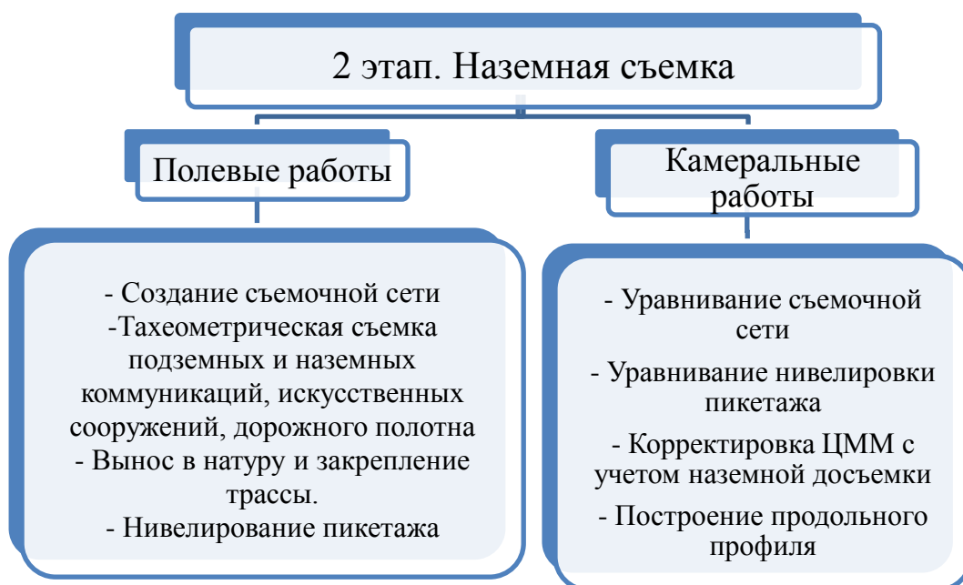
Рис. 7. Схема 2. Второй этап изысканий

Проведем сравнительный анализ сроков выполнения работ, аэрофотосъемки в комплексе с наземным методом (табл.1) и без нее, только наземным методом съемки (табл. 2), на примере изыскания автомобильной дороги «А340 Улан-Удэ – Кяхта, Республика Бурятия».