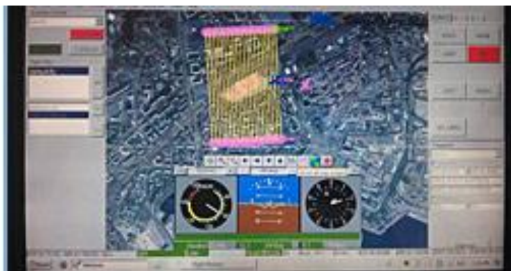
Рис.3. Наземная контрольная станция управления