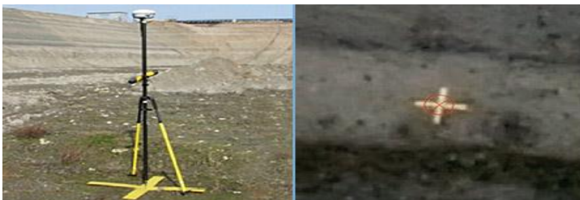
Рис. 4. Закладка опознавательных знаков

В случае наступления нештатной ситуации станция позволяет оператору немедленно вмешаться и прервать полет, и автоматически вернуть и посадить самолет на место запрограммированной посадки. Полученные наборы данных представляют собой изображения, привязанные к опознавательным знакам. Опознавательные знаки закладываются и привязываются к пунктам ГГС при помощи GPS оборудования методом спутниковых наблюдений (рис 4.). Количество изображений зависит от размера области работы и требуемого разрешения.