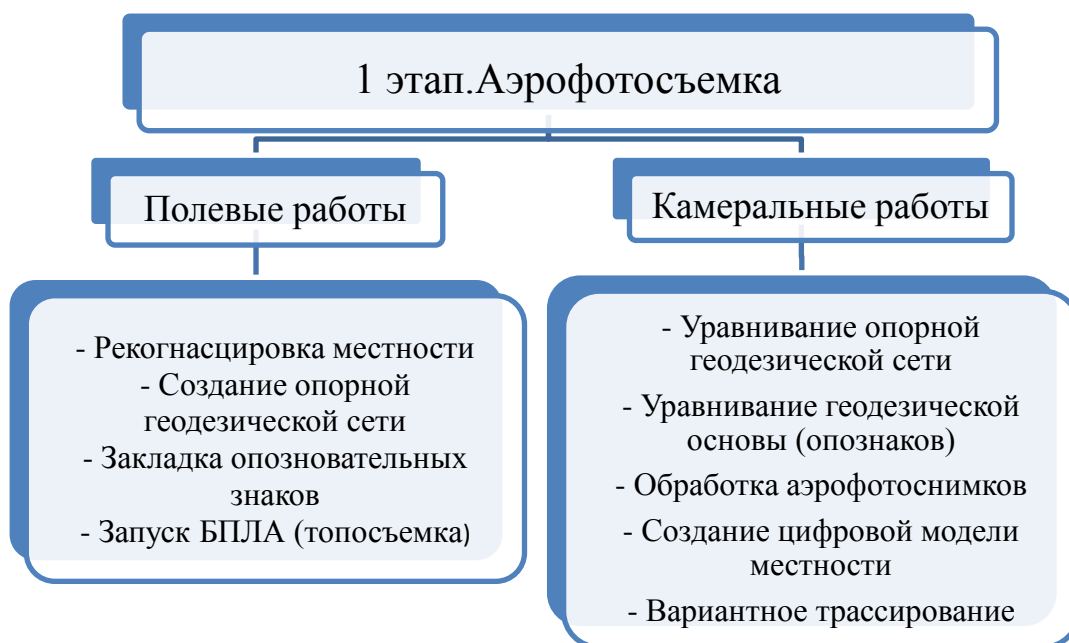
Рис. 6. Схема 1. Первый этап изысканий

подземные и наземные коммуникации, искусственные сооружения, дорожное полотно существующей автомобильной дороги. Поэтому наиболее целесообразно применять эти методы съемки в комплексе друг с другом поэтапно: