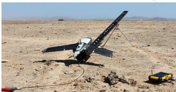
Рис. 2. Беспилотный летательный аппарат «GateWingX100»

Пример такой технологии— беспилотник из Бельгии «GateWingX100» (рис.2). Беспилотный летательный аппарате (БПЛА) Gatewing предназначен топографической съемки участка местности, создания качественных ортофотопланов и цифровой модели местности.