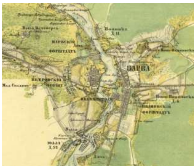
Рис. 5. Ивангород на карте Санкт-Петербургской губернии 1860 г.

На протяжении XVIII-XIX веков развитие Ивангорода, ставшего частью Нарвы, шло по плану, лично утверждённому Екатериной II в 1784 году, в результате чего паса́д Ивангорода получил существенное развитие в плане (рис. 5–6).