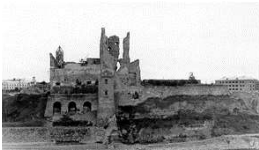
Рис. 8. Вид руин Нарвского замка со стороны Ивангорода, послевоенное фото

Послевоенный период градостроительной деятельности связан с восстановлением и отстройкой города заново, в это время город значительно увеличил, свою площадь за счёт: малоэтажной деревянной застройки, развивающейся во всех направлениях; увеличения площадей, занятых многоквартирной застройкой в северо-восточном направлении вдоль основной транспортной магистрали М11(Е20) «Нарва».