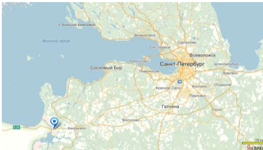
Рис. 1. Географическое положение Ивангорода

Город Ивангород (рис.1) входит в состав Кингисеппского муниципального района Ленинградской области и расположен на правом берегу реки Нарвы в 131 км от Санкт-Петербурга на пути федеральной автомобильной дороги М11(Е20) «Нарва» – Санкт-Петербург (Россия) – Таллинн (Эстония). Расстояние до Таллинна 230 км, до берега Финского залива 16 км.