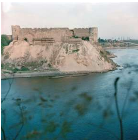
Рис. 7. Вид руин Ивангородской крепости, пострадавшей в годы Великой Отечественной войны, со стороны г. Нарва, 1966 г.

Но дальнейшему развитию города, помешала Великая Отечественная Война (рис. 7–8), в результате боевых действий Ивангород был практически-полностью разрушен, сильно пострадала крепость. После захвата Ивангорода в крепости было устроено два концлагеря для военнопленных. 25 июля 1944 года город был освобождён. Перед отступлением немцы успели взорвать 6 угловых башен, тайник, большие участки стен и внутренние постройки крепости (рис. 9).