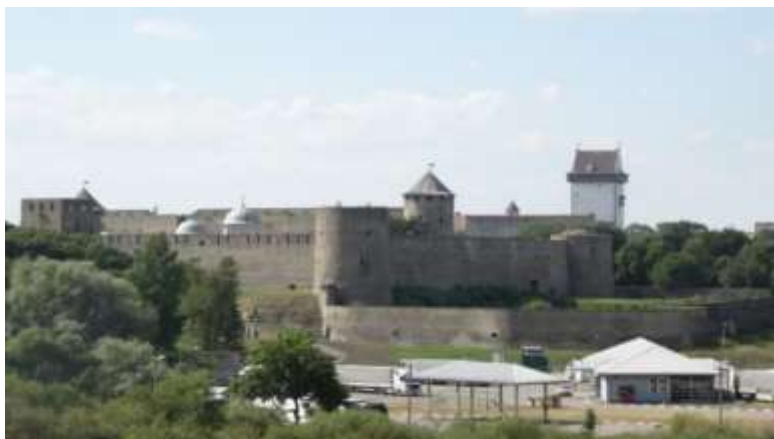
Рис. 2. Объект культурного наследия федерального уровня ансамбль Ивангородская крепость, вид с ул. Садовая.

Основные градообразующие предприятия города: АО «Завод КВОИТ» (производство котельно-вспомогательного оборудования); АО «Ленэнерго» ГЭС-13 (гидроэлектростанция); ООО «АИН» (Текстильное производство); Филиал ОАО «ЛОЭСК» «Ивангородские горэлектросети» (Ленинградская областная управляющая электросетевая компания); ООО «Вакрус» (аренда машин и оборудования без оператора, прокат бытовых изделий и предметов личного пользования); ООО «Экотехнология» (предоставление услуг в области производства пластмассовых деталей); ООО «Восточное побережье» (рыбная промышленность); ООО «Юникс» (рыбная промышленность); Ивангородский копильный цех рыбокомбината «Пищевик» (пищевая промышленность); ГУП Гипрорыбфлот «Экос» (производство лечебно-профилактических препаратов); ООО «Капир» (семена на бумажной ленте, деревообработка, розничная торговля); ДГУП «РОСТЭК-Кингисепп» (внешнеэкономическая деятельность); ООО «Иура Корпорейшн РУС» (Изготовление комплектующих).