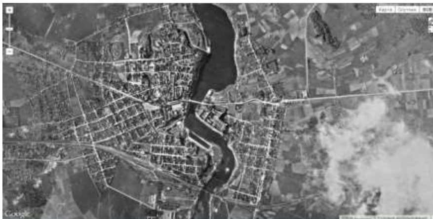
Рис. 6. Аэрофотоснимки Ивангорода, сделанные в период с 1939 по 1941 гг. с привязкой к API Google Maps. В подавляющем большинстве снимки сделаны немецкими самолетами-разведчиками

улиц. Пересечение этих улиц с трактом, ведущим на Санкт-Петербург и между собой сформировало первые узлы транспортной сети города. В этот же период времени сформировался промышленный узел в юго-западном направлении от Крепости, на острове выше по течению реки Наровы. Там размещался комплекс льноджутовой фабрики, основанной еще в 1851 г. известным русским банкиром и меценатом бароном А.Л. Штиглицем.