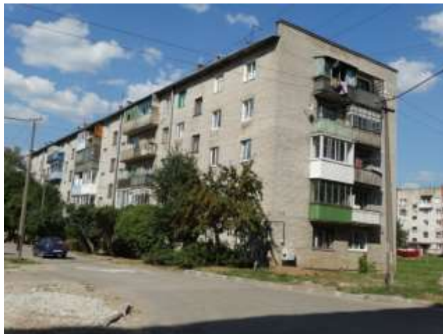
Рис. 9. МО «Город Ивангород», ш. Кингисеппское, д. 28, пятиэтажный кирпичный 70-ти квартирный дом 1972 года постройки.

Северная селитебная часть Ивангорода сформированы индивидуальной и блокированной жилой застройкой 1950–1970 годов, растянутой по обе стороны от местной улицы Госпитальной, а северо-восточная, между местной улицей Федютинского и магистралью Кингисеппского шоссе, 5–9-этажными кирпичными и панельными жилыми домами (рис. 9) 1970–1990 годов постройки.