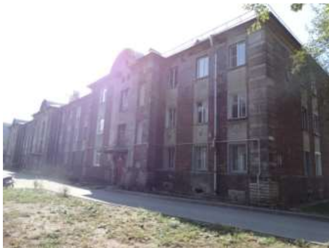
Рис. 11. МО «Город Ивангород», ул. Льнопрядильная, д. 23, трёхэтажный кирпичный 30-ти квартирный дом 1917 года, выполненный в английском стиле. Выявленный объект культурного наследия «Комплекс Нарвской мануфактуры».