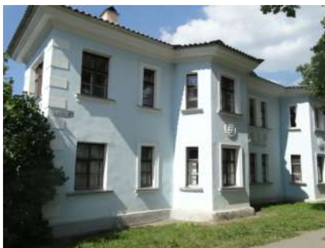
Рис.10. МО «Город Ивангород», ул. Гагарина, д. 21, двухэтажный секционный кирпичный 8-ми квартирный дом 1955 года постройки. Средовая застройка.

Селитебные территории южной части Ивангорода сформированы преимущественно многоэтажными панельными и кирпичными жилыми домами 5-9 этажной 1970-1980 годов постройки и малоэтажными секционными домами в 1–3 этажа (рис. 10) 1950–1960 годов, расположенными вдоль магистральной улицы Гагарина. В восточном направлении, по улицам Матросова, Строителей и Комсомольской, развивается индивидуальная и блокированная жилые застройки 1950–1980 годов. В западном, по улицам Садовой, Высокой и Псковской, индивидуальная и блокированная жилая застройка 1910–1980 годов, протянувшаяся до крепостного комплекса. В восточном направлении от улицы Гагарина, между улицами Маяковского и Лесной, расположена промышленная зона. Район Парусинка, на острове выше по течению реки Нарва и связанный с Ивангородом двумя мостами, выходящими на улицу Гагарина, сформированный 2–4 этажными кирпичными и бутовыми домами по улицам Пасторова 1950–1960 годов и Льнопрядильной (рис.11–12) 1914–1917 годов и девятиэтажной кирпичной застройкой 1978 года.