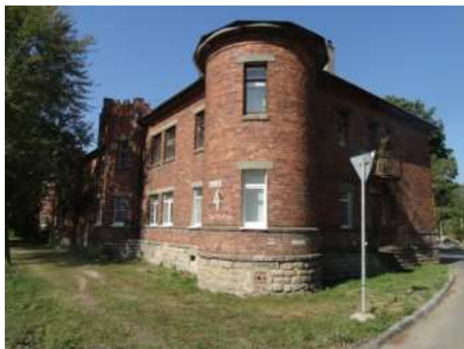
Рис. 12. МО «Город Ивангород», ул. Пасторова, д.4, двухэтажный кирпичный 16-ти квартирный дом 1946 года. Выявленный объект культурного наследия «комплекс Нарвской мануфактуры».

Инвестиции из ряда федеральных и международных программ, развитие и «реанимация» собственных производств, после упадка 1990-х годов, а так же развитие внутреннего и приграничного туризма позволили значительно улучшить градостроительную ситуацию и состояние жилого фонда.