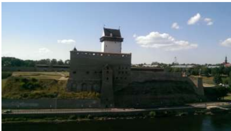
Рис. 3. Нарвский замок, вид с башни Ивангородской крепости.