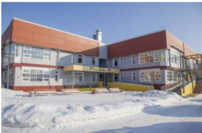
Рис. 2. Детский сад №181 по ул. Розы Люксембург