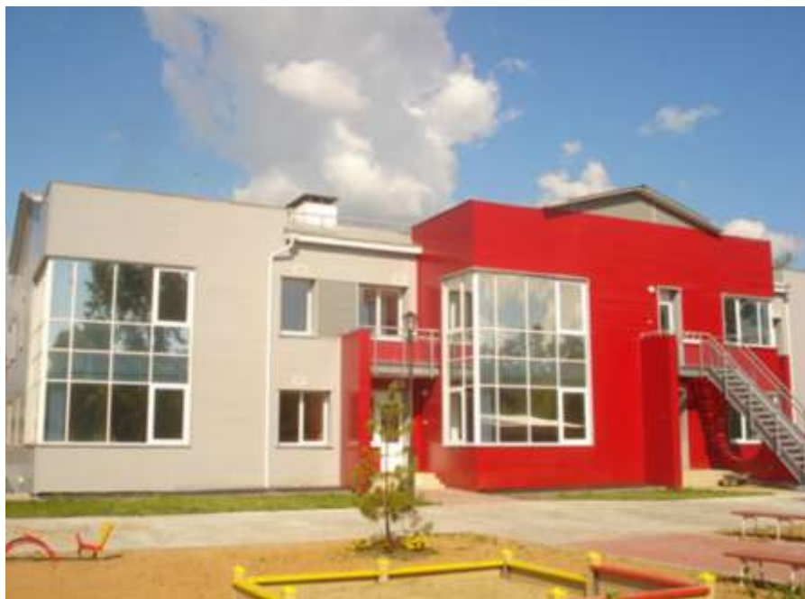
Рис. 1. Детский сад №31 по ул. Баррикад

Количество детских садов в населенном пункте должно отображать демографическую ситуацию в стране. Радиус обслуживания детского сада в городе составляет 300 м. Если взглянуть на карту Иркутска или городов Иркутской области, станет понятно, что детских садов во многих районах не хватает.